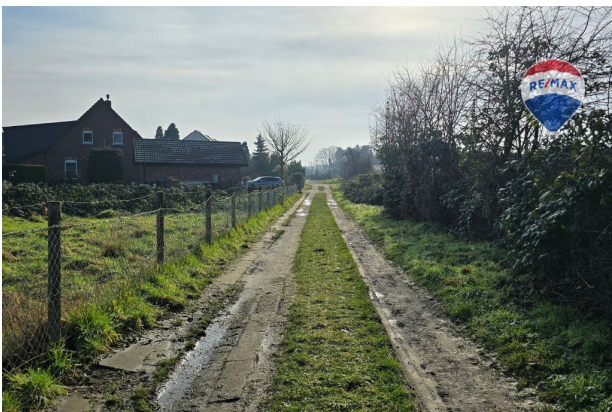
Fuß- u. Radweg (in Planung)