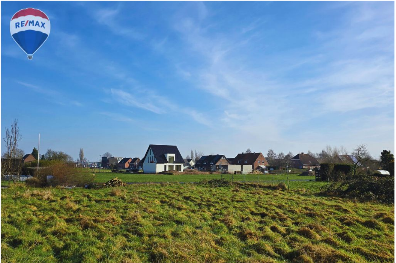
Ansicht Richtung Osten